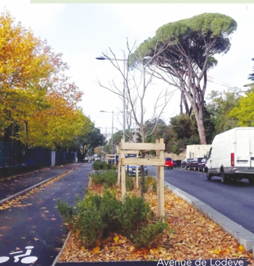
Avenue de Lodève

L es travaux attendus depuis plus de 10 ans sont enfin réalisés.