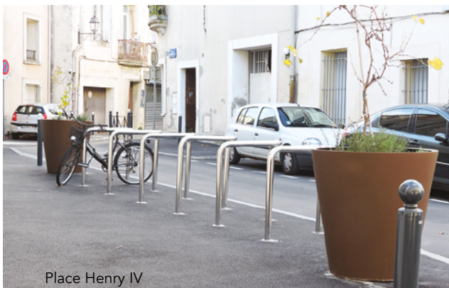
Place Henri IV

D es arbres et des massifs ont été plantés (avenue de Lodève, allée Germain Boffrand, place Mansart), des pots viennent orner la rue Marcellin Albert et la rue du bassin.