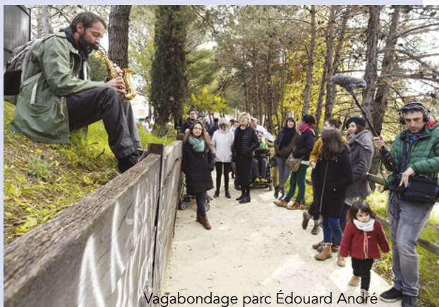
Vagabondage parc Édouard André

N'hésitez pas à aller les voir si vous les croisez en bas de chez vous !