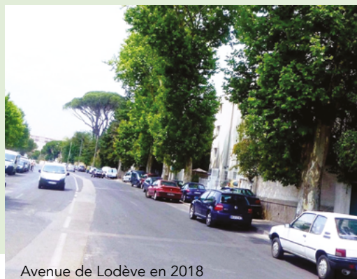
Avenue de Lodève en 2018

Éternel antagonisme entre automobilistes et adeptes des « déplacements doux ».